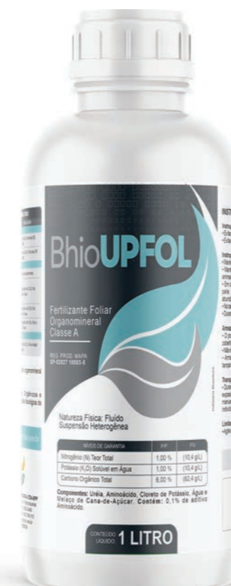
Fertilizante Foliar Organomineral Classe A

O Ecobhio BhioUPFOL possui componentes orgânicos e aminoácidos, que associados aos nutrientes de sua composição, auxiliam na atividade fisiológica vegetativa. Os aminoácidos possuem alta permeabilidade na membrana cuticular associando os nutrientes no processo e auxiliando sua absorção. Sua formulação e seus componentes permitem ainda que, parte do produto que cair no solo, seja amplamente ativo e utilizado também no complexo solo/planta o que facilita sua aplicação em qualquer estágio de desenvolvimento vegetativo da planta.