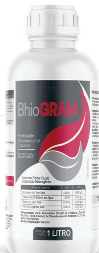
Fertilizante Organomineral Classe A

Fertilizante organomineral BhioGRAM foi desenvolvido para o fornecimento de nutrientes essenciais para o correto desenvolvimento radicular das plantas principalmente em seus estágios iniciais. Seu componente orgânico, associado aos aminoácidos e nutrientes minerais, estimulam o desenvolvimento do sistema radicular e auxiliam na manutenção das atividades microbológicas naturais do solo, diferentemente de grandes cargas de Nutrientes Minerais Solúveis que podem restringir essa atividade. No processo de enraizamento de culturas semi-perenes como a cana-de-açúcar, o BhioGRAM favorece o sistema vivo solo-planta, levando a um melhor fixação e atividades de absorção de água e nutrientes.