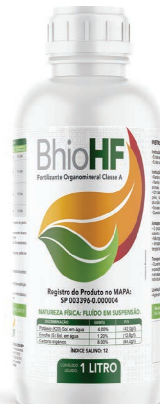
Fertilizante Organomineral Classe A

O BhioHF é um fertilizante organomineral e condicionador de solo, desenvolvido a partir de processos biodinâmicos ativos e enriquecidos com nutrientes e aminoácidos, voltado para o uso em hortifrutif. Destaca-se pela sua capacidade de potencializar o desenvolvimento microbológico em todos os tipos de solo com aumento na disponibilidade de minerais solúveis às plantas e redução dos danos causados por microorganismos fitófagos como nematódos. Além do aumento de produtividade, esses fatores se destacam pela melhor qualidade dos frutos e no aumento da longevidade produtiva da planta.