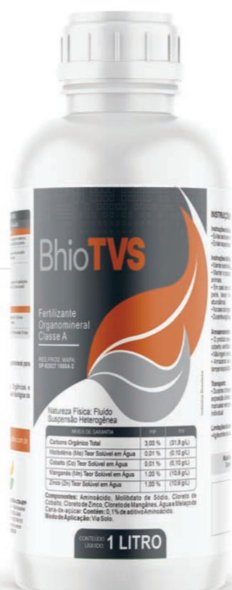
Fertilizante Organomineral Classe A

Fertilizante organomineral constituído dos micronutrientes Mo, Co, Mn, Zn, carbono orgânico e aminoácidos. O BhioTVS , além de fornecer elementos nutricionais, o carbono orgânico e os aminoácidos componentes são associados à microbiologia local, estimulando o desenvolvimento e o aumento da atividade microbológica natural. Os aminoácidos auxiliam na absorção dos nutrientes disponíveis e no desenvolvimento radicular, em especial na formação das raízes primárias. Seu uso deve ser feito diretamente via solo, em sulco de plantio junto à semente, estruturas vegetativas de propagação ou banhando o solo das mudas antes do plantio. É indicado para as culturas de eucalipto, laranja, seringueira, café, manga, goiaba, pêssego, banana, melancia, mamão, amendoim e algodão.