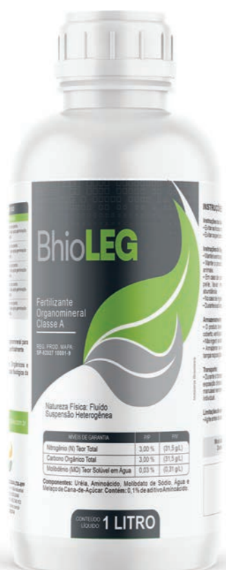
Fertilizante Organomineral Classe A

Fertilizante organomineral composto de N, Mo, Carbono Orgânico e Aminoácidos, que, uma vez aplicados via solo, na região da rizosfera, estimulam a atividade microbológica natural, cuja atividade tem grande potencial de auxiliar no desenvolvimento das raízes, estrutura essencial para o correto desenvolvimento vegetativo e produtivo. O BhioLEG pode ser associado aos microorganismos fornecedores de nitrogênio nas leguminosas. A aplicação deve ser feita no solo, no sulco de plantio para que permaneça junto às sementes, e em adição, a aplicação via solo com uso de barra de pulverização aos 10 dias após a germinação das plantas.