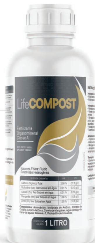
Fertilizante Organomineral Classe A

O LifeCOMPOST é um componente organomineral, recomendado para garantir o fornecimento de nutrientes ao complexo solo/planta quando aplicado ao solo junto à matéria orgânica natural ou depositada, podendo ser aplicado diretamente na matéria orgânica da compostagem antes da deposição no solo, reduzindo uma operação no campo.