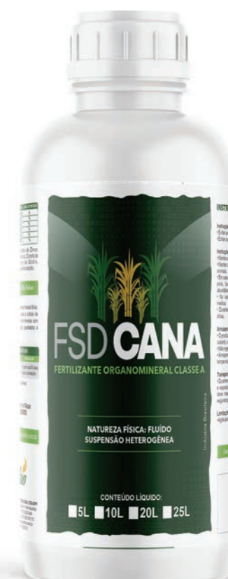
Fertilizante Organomineral Classe A

O FSD Cana é um fertilizante mineral desenvolvido para o seu uso em absorção foliar para a cultura de cana-de-açúcar composto por macro e micro nutrientes essenciais à planta. Essa cultura, com grande capacidade produtiva, necessita de acréscimo nutricional para atingir seu potencial, que o FSD Cana possui de forma balanceada em sua composição. Formado por minerais quelatizados, que se encontram totalmente disponíveis à absorção foliar.